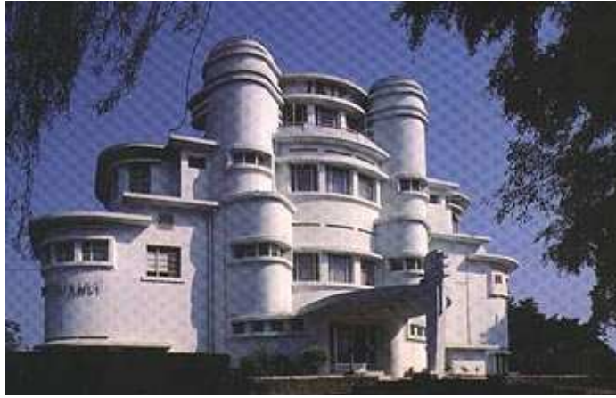
Vorgevel villa Isola, Bandung (1932). Ontwerp: C.P. Wolff Schoemaker.