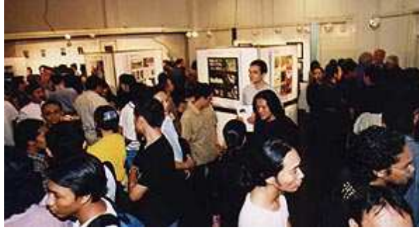
Overzicht van de tentoonstelling Young Dutch Architects 2000 in het Nederlands Cultureel Centrum (Erasmushuis) in Jakarta tijdens de opening. Behalve officials waren ook opmerkelijk veel architectuurstudenten aanwezig.