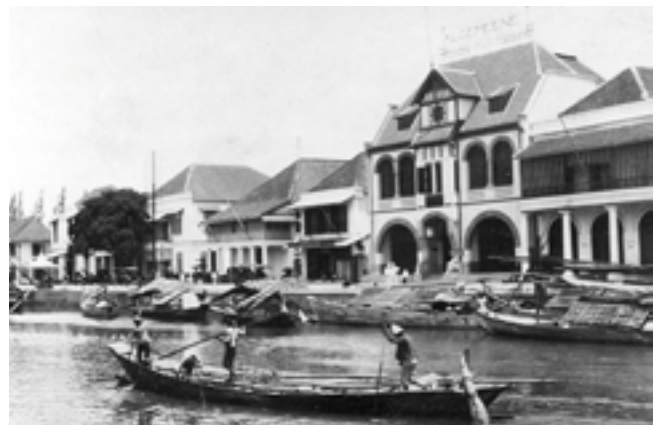
Afb. 2. Surabaya kantoorgebouw 'Levens- en Lijfrenteverzekeringmaatschappij De Algemeene' (1900-1902), H.P. Berlage