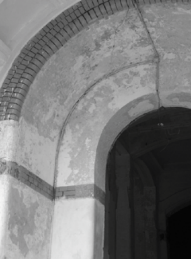
Afb. 6. Detail entree van het Kunstkringgebouw Jakarta

constructieve en decoratieve elementen gerespecteerd worden of de authentieke situatie wordt teruggebracht. Hoewel Abieta in dit opzicht over voldoende kennis beschikt is niet uit te sluiten dat wensen van de opdrachtgever tot een daarvan afwijkend eindresultaat leiden. Een probleem dat nog wordt versterkt door het grotendeels ontbreken van historisch gegevens over het gebouw die bij de restauratie als referentie kunnen dienen. Een laatste, prangend probleem is dat nog geen beslissing is genomen over de functie van het herstelde gebouw. Het thans voorliggende voorstel het gebouw als hotel in gebruik te nemen strookt weliswaar met één van de voornemens (exploitatie door een particulier ondernemer) maar niet met een ander (openbare functie) en is bovendien nog verre van definitief. Het ontbreken van een beschrijving van de toekomstige functie van het gebouw plaatst de architect in een moeilijke positie: niet alleen immers moet hij ervoor zorgen dat het gebouw hersteld wordt, maar ook dat het na oplevering desnoods voor iedere gewenste functie bruikbaar is.