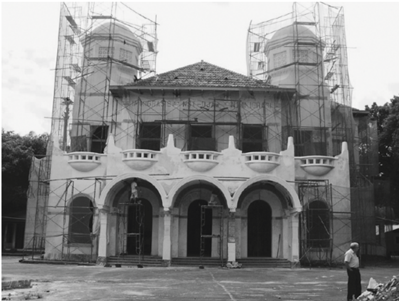
Afb. 4. Voorgevel van het Kunstkringgebouw (opname januari 2005)