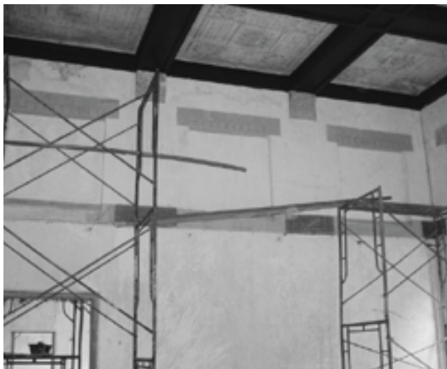
Afb. 5. Decoratie wand en plafond