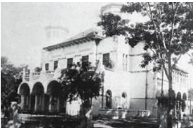
Afb. 1. Oude foto van de voor- en zijgevel van het gebouw voor de Nederlandsch-Indische Kunstkring (1914), Batavia van architect P.A.J. Moojen

Na zijn aankomst in de kolonie in 1903 vestigde Moojen na korte tijd zijn bureau in Batavia. Dit in tegenstelling tot de meeste ingenieurs die in dienst traden van een overheidsinstelling als het departement van Burgerlijke Openbare Werken. Vanwege zijn kennis, inzichten en opvattingen over architectuur en kunst waarvan hij zowel via zijn ontwerpen als via publicaties getuigde verwierf Moojen in korte tijd een vooraanstaande positie in vakkringen. Hij werd een van de grondleggers van een eigentijdse Indonesische bouwkunst en